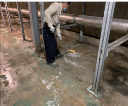
使用滾筒塗抹 Ultratect WS。 適用 400cc/ m 2