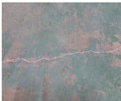
使用 Ultratect CR 填補裂縫。 Ultratect CR 是一種持久的裂縫修復劑產品。