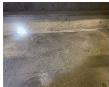
Ultratect CR 也應用在牆壁和角落。